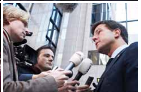
Eurooppa-neuvoston jäsenet puhuvat lehdistölle.