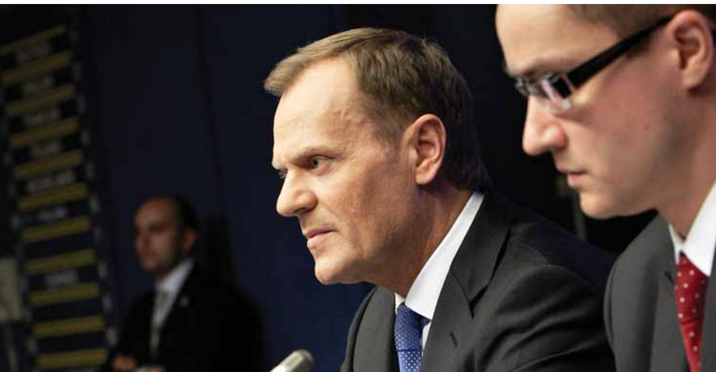
Vuoden 2011 jälkipuolisko, Puola EU:n ministerineuvoston puheenjohtajana

nopeuttamisesta ei joskus vain ole uskottava. Vaatii aikaa nivoa monenlaiset intressit ja näkemykset yhteen lujaksi, kaikkien kannalta hyväksyttäväksi päätökseksi. Kun uutta taloa suunnitellaan, pitäisikö sen valmistua viikossa? Aika on poliitikon sementtiä.