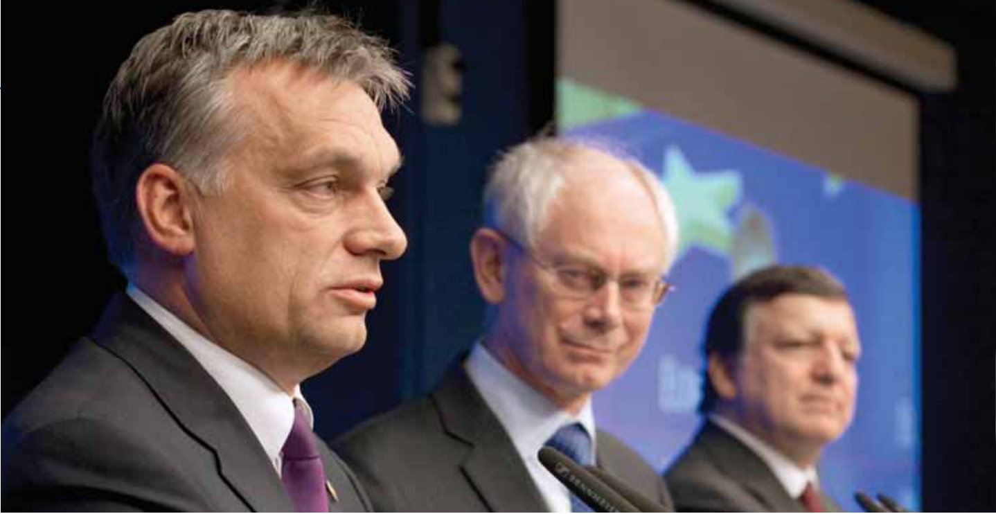
Vuoden 2011 alkupuolisko, Unkari EU:n ministerineuvoston puheenjohtajana

Alituisesti muuttuvassa ja epävakaisessa maailmassa vakaat poliittiset instituutiot voivat tarjota varmuutta ja jatkuvuutta ja auttaa meitä muovaamaan kohtaloamme. Unionin toimielimet ovat melko nuoria – vanhimmat niistä täyttävät 60 vuotta ensi vuonna, mikä on vähän verrattuna monien jäsenvaltioiden vuosisatojen ikäisiin parlamentteihin, neuvostoihin ja tuomioistuimiin. Mutta niillä on yhteinen pyrkimys: ohjata muutoksia, vaimentaa iskuja, määrittellä uusia suuntia.