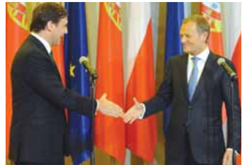
EU:n valtion- tai hallitusten päämiesten kokouksia eri puolilla Eurooppaa