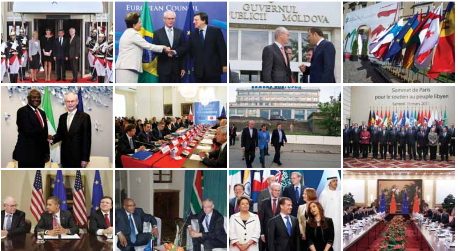
Huippukokouksia ja kokouksia kolmansien maiden kanssa