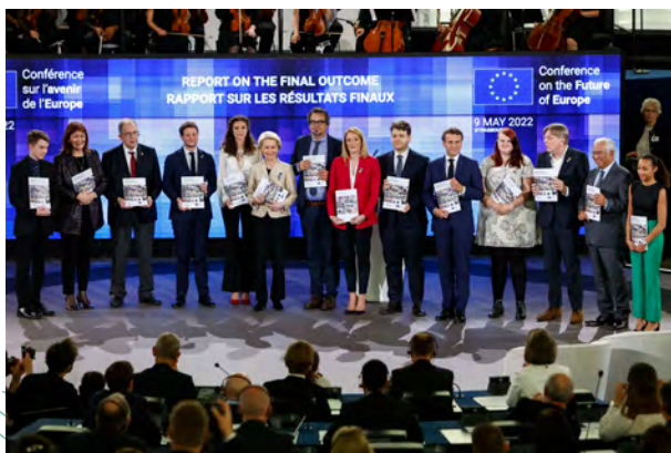
Conferenza sul futuro dell'Europa — Cerimonia di chiusura, 9 maggio 2022

Un numero significativo delle proposte e misure della Conferenza richiede il lavoro congiunto delle tre istituzioni nell'ambito della procedura legislativa ordinaria: la Commissione come principale promotrice della legislazione dell'UE e il Parlamento europeo e il Consiglio in qualità di colegislatori. Dal 9 maggio 2022 il Consiglio «Affari generali» , composto dai ministri e dai sottosegretari di Stato responsabili degli Affari europei, discute periodicamente del seguito della Conferenza.