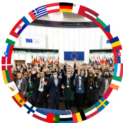
Conferenza sul futuro dell'Europa Riunione della componente dei cittadini

Il Consiglio ha partecipato attivamente con la presidenza di turno e i rappresentanti dei 27 Stati membri a diversi livelli durante tutta la Conferenza. I rappresentanti del Consiglio hanno sostenuto e incoraggiato i lavori dei cittadini nei panel (composti da cittadini selezionati in modo casuale) e nella sessione plenaria, dove i cittadini, i rappresentanti delle istituzioni dell'Unione europea (UE) e altre parti interessate hanno discusso le raccomandazioni dei cittadini.